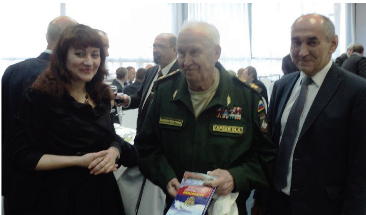
Генерал армии М.А. Гареев с руководством Научно-исследовательского центра проблем национальной безопасности и книгой «Патриотизм как фактор эффективного развития российской государственности», изданной Центром