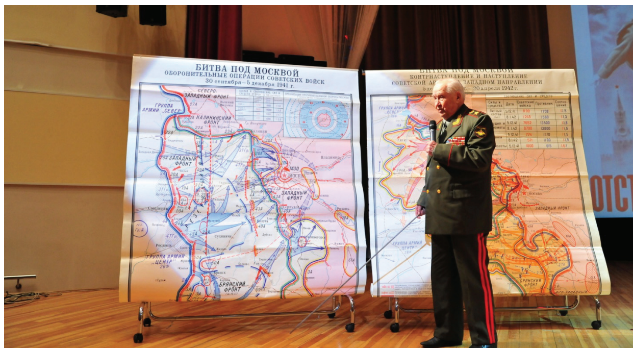
На конференции, посвященной 70-летию Битвы под Москвой в МГТУ имени Н.Э. Баумана

Большое значение в борьбе с фальсификацией истории Великой Отечественной войны сыграл историко-документальный фильм «Пролог Великой Отечественной войны: мифы и факты». Автором художественной идеи и руководителем работавшего над кинолентой творческого коллектива был генерал армии М.А. Гареев. Автору посчастливилось быть в составе творческого коллектива и работать над фильмом под руководством легендарного генерала М.А. Гареева. Тогда в результате поиска и изучения архивных документов (в том числе немецких) [8] были установлены события и факты предвоенного периода, развеявшие фейковые утверждения о якобы планировавшемся нападении СССР на Германию. В преддверии войны, в июне 1941 года у Советских Вооруженных Сил, не было планов не только нападения на Германию, но и стратегического развертывания на случай нападения на СССР. Единственный документ, который регламентировал действия Красной Армии на случай войны, был План стратегического развертывания еще 1938 года. В ходе работы над фильмом были изучены и представлены общественности директивы и приказы командующих округами, а также иные документы, свидетельствующие о том, что никаких мероприятий по подготовке к войне в приграничных округах не проводилось.