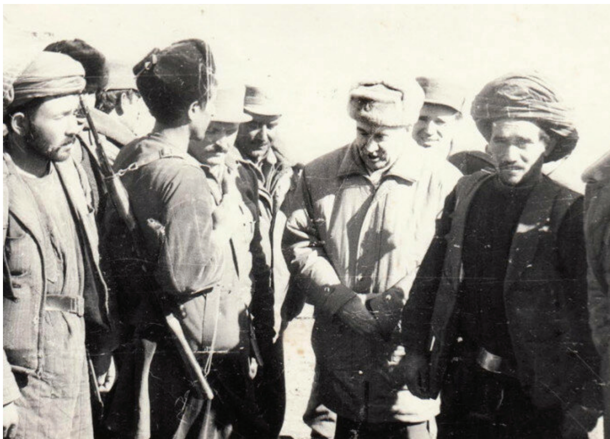
Главный военный советник генерал-полковник М.А. Гареев в Афганистане

Главе советской военной миссии генерал-полковнику М.А. Гарееву предстояло в условиях явного превосходства антиправительственной проамериканской коалиции с небольшой группой военных советников из СССР координировать действия афганской армии. Безусловно, нужно было обладать большим запасом мужества, ответственности, а также чувством офицерского долга, чтобы направиться в командировку в Афганистан в качестве советника обреченного на поражение и гибель М. Наджибуллы.