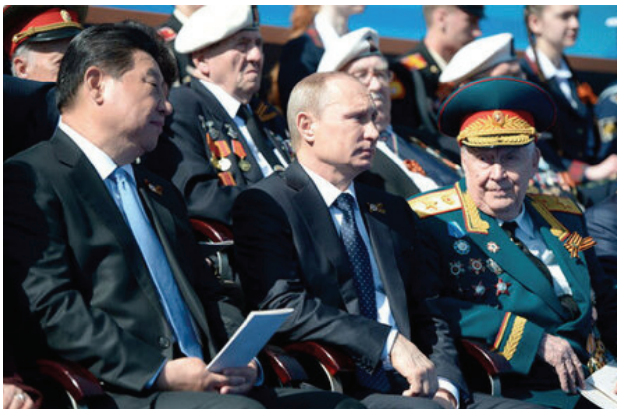
Парад Победы 2017 года. Рядом с Президентом России В.В. Путиным и Председателем КНР Си Цзиньпином

По сути, им был открыт свой фронт – военно-исторический. И на этом фронте он одержал одну из своих главных побед – побед над фальсификацией истории Великой Отечественной войны, СССР и России, в борьбе за мировоззрение российской молодежи, формирование и развитие общероссийского патриотизма. Это по достоинству было оценено и научным сообществом и руководством страны, а также всеми, кому не безразлична не только историческая память многонационального русского народа, но и его будущее.