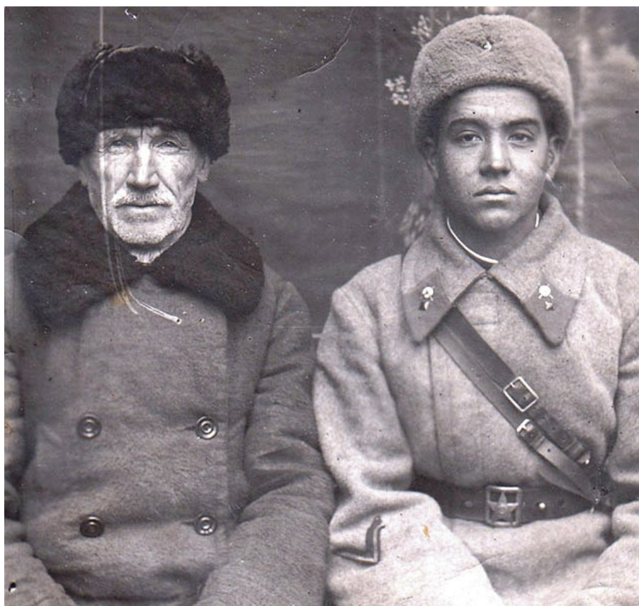
Перед уходом на фронт 1941 года с отцом

В 1940 году он решил попробовать свои силы на гражданском поприще. Узнав о том, что в Ленинабаде (Таджикистан) был открыт планово-экономический техникум, он начал в нем учиться. Но ни экономиста, ни бухгалтера из него не получилось. М.А. Гареева манила военная служба, поэтому, проучившись в техникуме менее года, он забрал из него документы и уже в марте 1941 года поступил в Ташкентское пехотное училище имени В.И. Ленина. «С апреля – марта начали учиться, – вспоминал Махмут Ахметович. – Уклон был артиллерийско-пулеметный, хотя училище и пехотное. А у каждого курсанта свой конь был» [5].