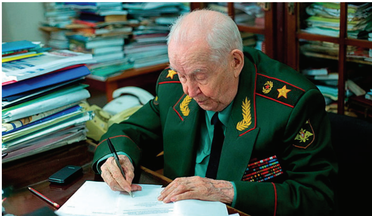
В рабочем кабинете

коммерческими структурами, работают на деньги работодателя и под заказ. У Академии военных наук России идеология деятельности кардинально противоположная – это некоммерческая, а общественная и общенародная организация, ориентированная на обеспечение интересов не заказчиков, а государства – Российской Федерации. Исходя из этого, думается было бы вполне логично и справедливо присвоить Академии военных наук имя генерала армии М.А. Гареева.