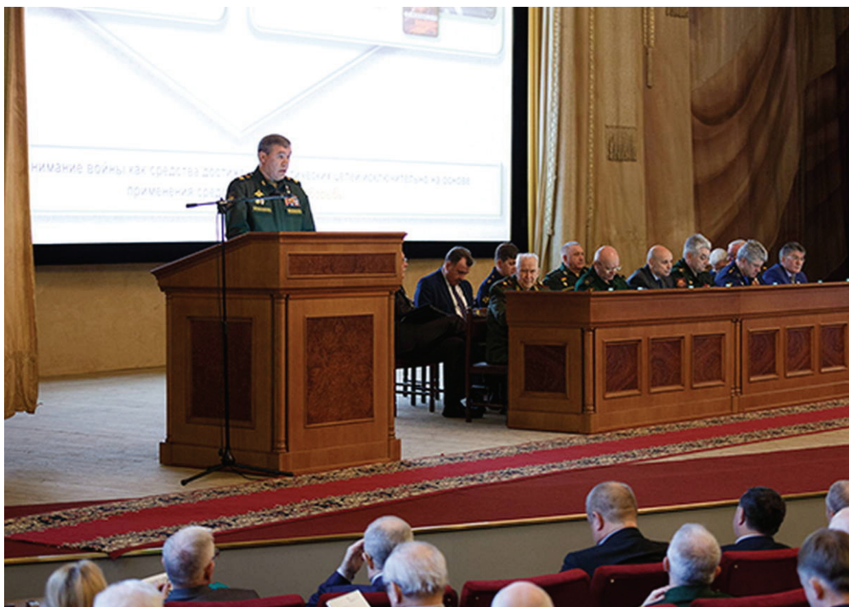
Выступление начальника Генерального штаба ВС РФ генерала армии В.В. Герасимова на военно-научной конференции Академии военных наук