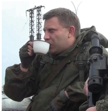
А. Захарченко на передовой

Первая попытка украинской диверсионной группы убить Александра Захарченко произошла 30 августа 2014 года. Тогда по автомобилю, в котором ехал Захарченко, были произведены выстрелы. Сам он не пострадал,