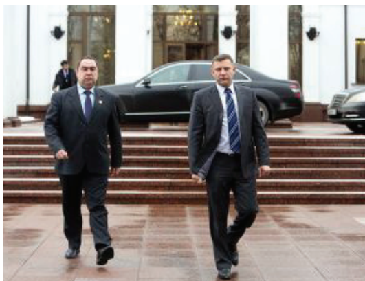
Лидеры ЛНР и ДНР Игорь Плотницкий и Александр Захарченко (слева направо) по окончании переговоров в «нормандском формате» по урегулированию кризиса на юго-востоке Украины, 2015 год

Это была первая, уже политическая, победа Донецкой и Луганской народных республик, заставивших политическое руководство Украины вести переговоры и договариваться по основным положениям урегулирования украинского кризиса на Донбассе. От имени ДНР соглашение было подписано А.В. Захарченко.