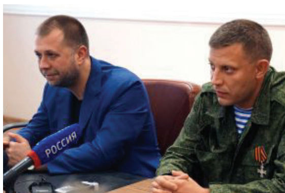
Бывший премьер-министр Донецкой народной республики Александр Бородай и новый премьер-министр ДНР Александр Захарченко (слева направо) на пресс-конференции в Донецкой областной госадминистрации, 2014 год

8 августа 2014 года, после ухода в отставку с поста председателя Совета министров Донецкой Народной Республики А. Бородай, А. Захарченко был утверждён в этой должности Верховным советом ДНР. В тот же день он принял присягу на верность народу ДНР, в которой заявил о первоочередных военных задачах, среди них значилось: «Создание единого воинского командования республики, обеспечение победы на фронте и формирование родов войск» 222 .