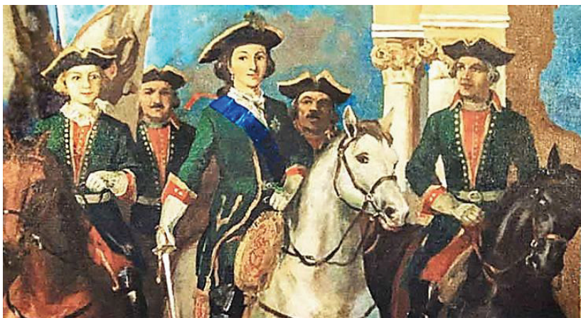
Дашкова и Екатерина II во время переворота 28 июня 1762 года

В эпоху дворцовых переворотов Дашкова играла активную роль в событиях, приведших к власти Екатерину II, однако её роль в этом событии в реальности была намного меньше, чем казалась с её собственных слов. Муж Дашковой служил в элитарном Преображенском полку, а потому княгиня была хорошо знакома со многими гвардейскими офицерами, недовольными политикой Петра III.