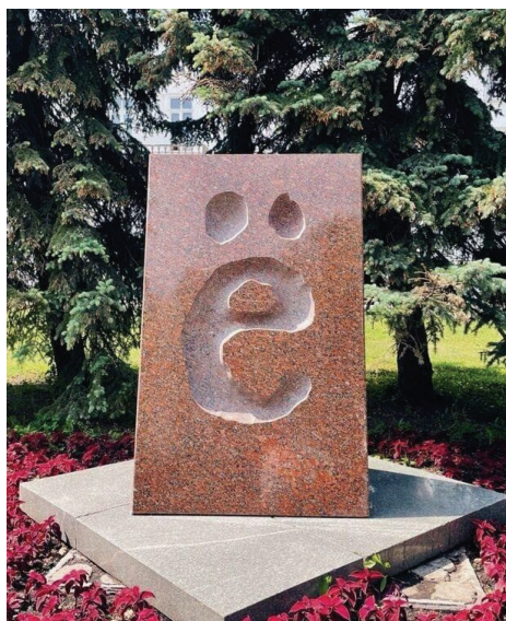
Памятник букве ё в Ульяновске

В Петербургской академии наук проявлялись административные таланты Е.Р. Дашковой, в Российской академии раскрылись её творческие дарования.