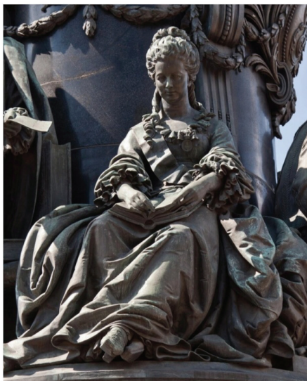
Е.Р. Дашкова на памятнике Екатерине II в Санкт-Петербурге

В 1985 году в её честь назван кратер на Венере.