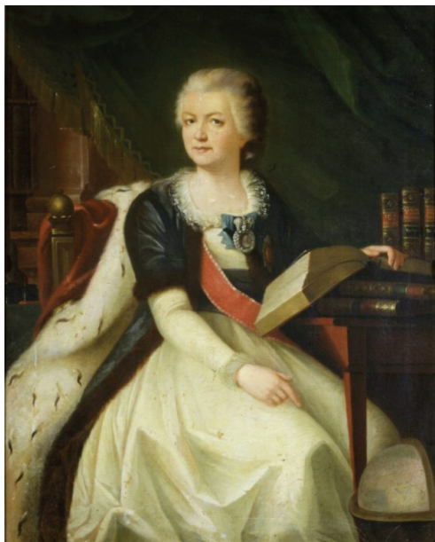
Парадный портрет Воронцовой-Дашковой, 1790-е. Неизвестный художник

Пытаясь на практике воплотить просветительские идеалы, Дашкова ставит в центр внимания своего директорства вопросы хозяйственно-экономического уклада, научно-просветительскую и издательскую деятельность. Деятельный директор добилась, чтобы при Академии были открыты общедоступные публичные чтения, на которых знаменитые учёные могли прочесть всем желающим лекции по основным областям естественных и точных наук.