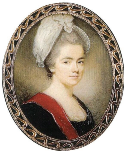
Е. Р. Дашкова. 1770-е годы

женщины, большие поклонницы просветительских сочинений философов-энциклопедистов, они были «единодушны в том, что просвещение – залог общественного блага», грезили о способах приближения «царства разума», о «государе, любящем и уважающем своих подданных» 115 .