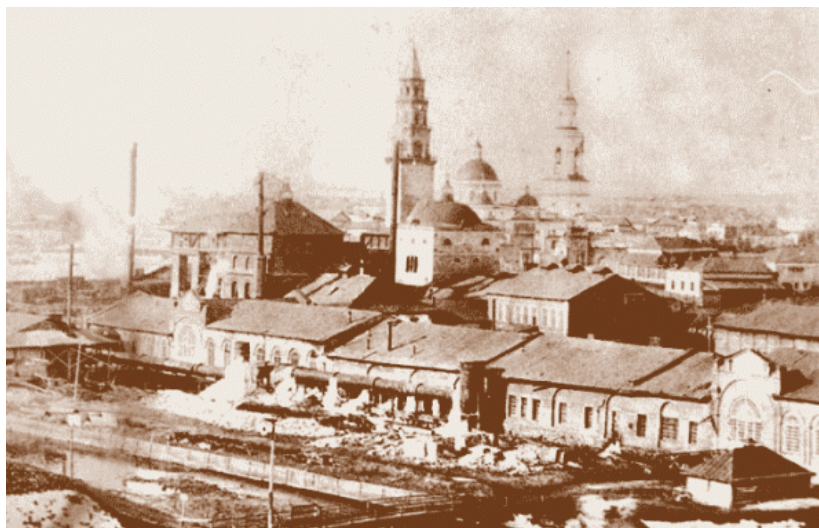
Невьянский металлургический завод

Очевидно, что данное послание Петра сыграло свою роль. И уже в январе 1703 года Невьянский завод отправил первую партию своей продукции. За зиму было произведено 50 пушек крупного калибра и много железа.