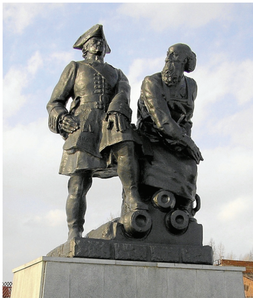
Памятник Петру I и Никите Демидову в Невьянске

Пётр был очень доволен деятельностью Н. Демидова. Это, впрочем, не обеспечивало его абсолютную безнаказанность. О чём свидетельствуют итоги острого конфликта между Н. Демидовым и В. Татищевым, создавшим Горную канцелярию – первый коллегиальный орган заводского управления на Урале. По словам историков, Демидов и Татищев обменялись обвинениями в коррупции. Промышленник добился временного отстранения Татищева от