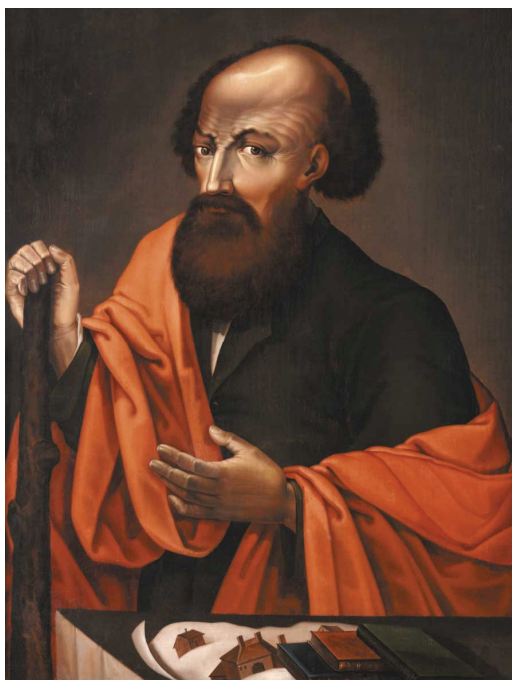
Портрет Никиты Демидова

Не оставил Никита Демидов без внимания и другие отрасли производства. Так, в частности, он внедрил известное еще с древних времен производство асбеста или горного льна. Месторождение асбеста было открыто в 1720 г. на Тагиле, близ