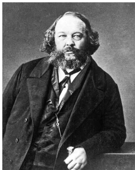
М. А. Бакунин

следнее пойти на уступки террористам. Анархисты считали, что истинный порядок может возникнуть только из хаоса, который невозможен в условиях существования государственного строя. Во имя порядка государство должно быть разрушено. И этот разрушительный потенциал был в полной мере использован в ходе Великой Октябрьской социалистической революции. Но потом, когда цели были достигнуты, пришедшая к власти партия большевиков пересмотрела свои взгляды и на анархистов, и на продвигаемую ими концепцию отмирания государства.