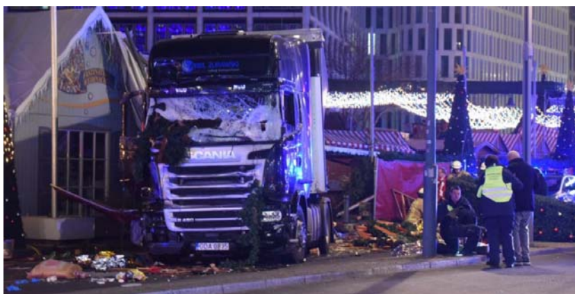
Теракт на рождественской ярмарке в Берлине 19 декабря 2016 г.

– 2016 г. – вновь теракты в Париже, Брюсселе, Ницце, Стамбуле, Берлине и других городах мира.