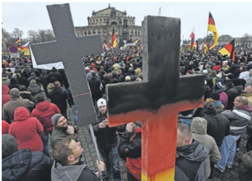
В Старом Свете появились новые крестоносцы 1

Таким образом, европейские страны, в том числе члены Евросоюза, переживают в настоящее время настоящий ренессанс экстремизма праворадикального толка.