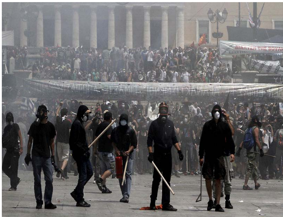
Греческие анархисты во время одной из акций. Август 2011 г.

Активно анархисты участвуют в уличном противостоянии с неонацистами и неонацистами, а также полицией и в целом в беспорядках в других странах, инициируемых другими ультралевыми экстремистами.