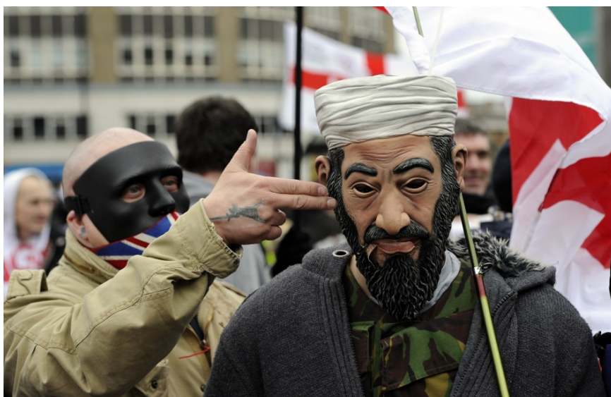
Антиисламский митинг в Лондоне 29 мая 2013 г.

При этом ультраправое влияние в Великобритании обусловлено не только активной неонацистской пропагандой, но и объективными социальными противоречиями, с каждым годом только обостряющимися, а также, судя по публикациям ревизионистского характера и демонизации образа мусульманина, определенным попустительством межнациональной розни, которое присутствует сегодня в СМИ, причем эта проблема ведет к усилению как ультраправых, так и квазирелигиозных экстремистских настроений.