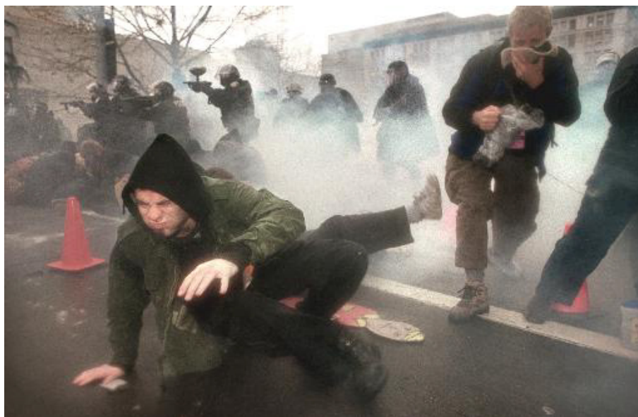
Столкновения антиглобалистов с полицией в Сиэтле в ноябре 1999 г.

Другое, не менее авторитетное движение – Reclaim the Street («Вернем себе улицу»). Именно оно наиболее ревностно требует списания внешних долгов стран третьего мира. По мнению членов организации, эти внешние долги возникли из-за политики, навязанной чиновниками МВФ и лидерами ЕС.