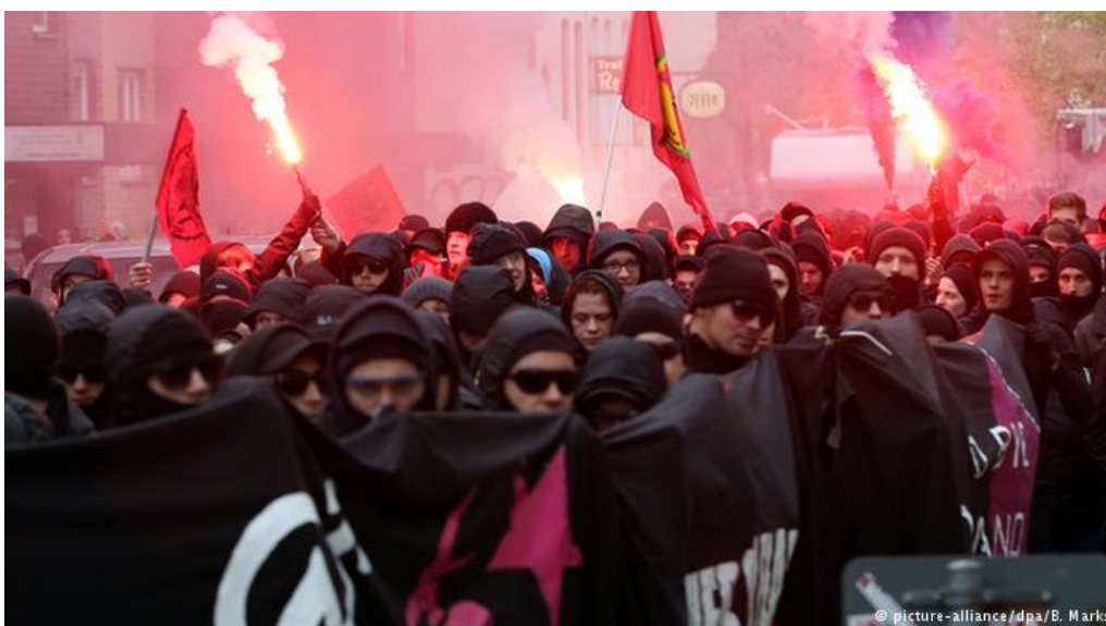
Левые экстремисты на демонстрации в Гамбурге 1 мая 2016 г.

Согласно представленным данным в 2013 г. в стране было зарегистрировано 31 545 актов экстремистского характера, что на 15,3% больше, чем в 2012 г. Из них 8 673 преступления совершено лицами, которых МВД относит к сторонникам левого политического спектра (рост 40,1%), и 17 024 – сторонниками правого спектра (снижение на 3,3%). 1 354 преступления совершены с применением насилия (рост 38%), из них 84% совершены левыми экстремистами. Как подчеркнул де Мезьер, «насилие особенно резко возросло при проведении демонстраций и митингов» 1 .