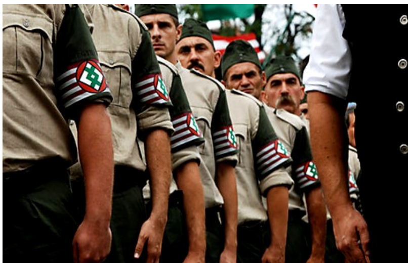
Боевики партии «Йоббик» на марше 3

Так, в Венгрии открыто функционирует неонацистская партия «Jobbik», известная своей поддержкой идеи создания концентрационных лагерей для венгерских цыган. Помимо этого на территории страны, по данным СМИ, существует по меньшей мере восемь секретных лагерей для постоянного обучения неонацистов, в том числе тренировочный лагерь экстремистского Венгерского национального фронта, предназначенный для кандидатов, которые докажут, что они не евреи или цыгане 2 .