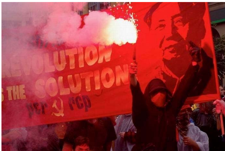
Акция антиглобалистов в Торонто в 2010 г.

В последующем практически все саммиты так называемой G7 (8) так или иначе сопровождались акциями протеста антиглобалистов, в том числе посредством провоцирования уличных беспорядков. Не стали исключением и события, связанные с последним по времени саммитом «Большой семерки» в Эльмау в Германии в июле 2015 г. Антиглобалистами были перекрыты шоссе и заблокированы железнодорожные пути. В результате на несколько часов было прервано движение поездов. Для поддержания порядка власти ФРГ вынуждены были запросить помощь у соседней Австрии, откуда для наведения порядка были направлены две тысячи полицейских.