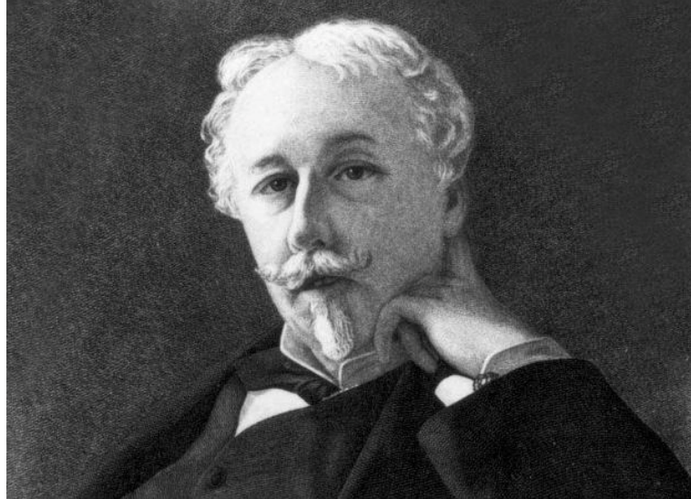
Жозеф Артюр де Гобино (1816–1882) – французский антрополог и расолог

Так, в частности, Ж. Гобино в работе «О неравенстве человеческих рас» подчеркивал, что главным фактором существования и процветания цивилизации является «чистота расы». По мнению Ж. Гобино, этническое смешивание приводит к «вырождению человека». Он выстраивает «иерархию рас»: