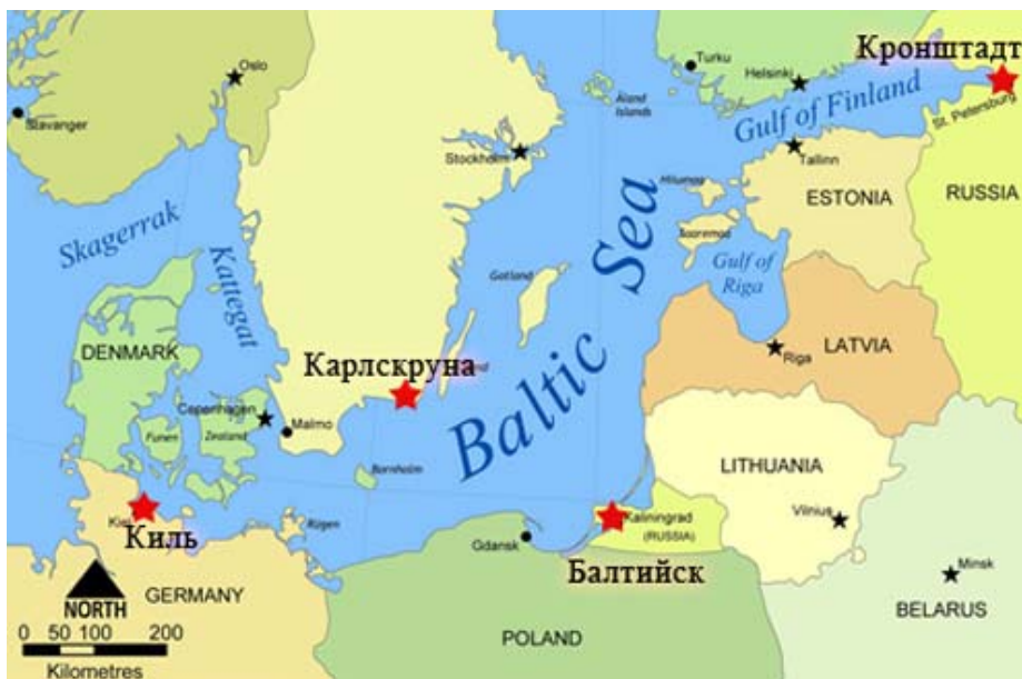
Рис. 2. Военные базы НАТО в акватории Балтийского моря 1

Таким образом, налицо скрытая закамуфлированная экспансия НАТО в страны Балтии с тем, чтобы не только продемонстрировать присутствие или солидарность, но и обеспечить освоение инфраструктуры, которую можно будет использовать в военных целях. В перспективе, по всей видимости, подобная тактика «вползания» НАТО в регион будет продолжена.