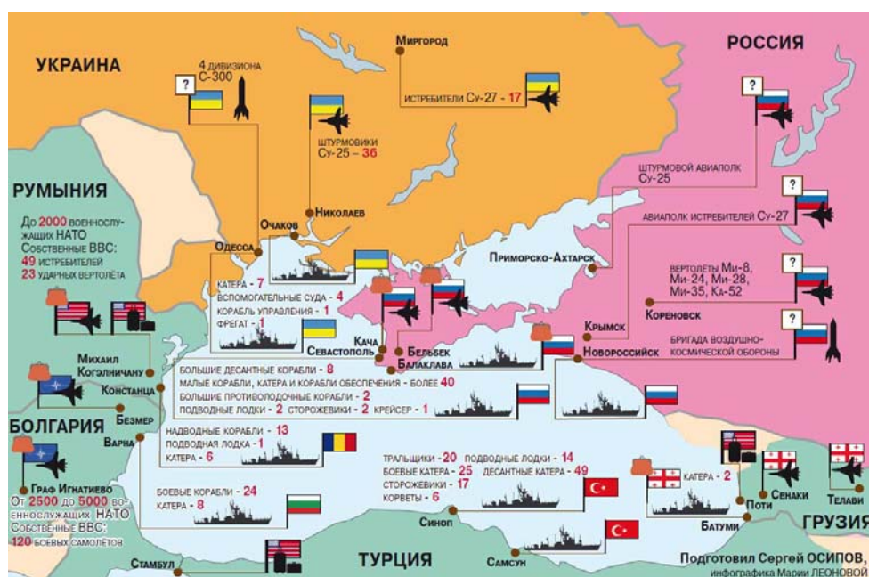
Рис. 3. Военный потенциал мировых держав и НАТО на Черном море 1

Наибольшего напряжения военно-политическая ситуация в регионе достигла в июле 2014 г., когда под предлогом проведения учений в Черном море была сосредоточена группировка из более чем двух десятков кораблей НАТО классом выше тральщика. Причем в отличие от аналогичных учений предыдущих лет учения 2014 г. были максимально приближены к территориальным водам России (рис. 3).